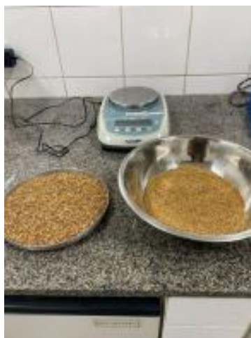
Figura 1 - Farinha do albedo da casca do maracujá do mato.

A extração do albedo do maracujá do mato ocorreu manualmente com o auxílio de uma faca esterilizada e, em seguida, o albedo foi levado para a secagem em estufa a temperatura de 60 °C até chegar em consistência ideal. Após isso, o albedo seco foi triturado em um liquidificador até chegar na consistência de farinha para ser peneirado (Figura 1).