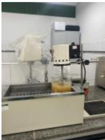
Figura 2 - Mistura no agitador magnético com aquecimento.