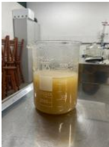
Figura 3 - Sobrenadante após a purificação.

Em seguida, a solução passou pela etapa de purificação. Para isso, foi necessário separar os resíduos do extrato clarificado (sobrenadante) através da centrifugação a 10.000 rpm, durante 10 min para cada porção. Concluída essa etapa, o sobrenadante foi acondicionado em um becker (Figura 3).